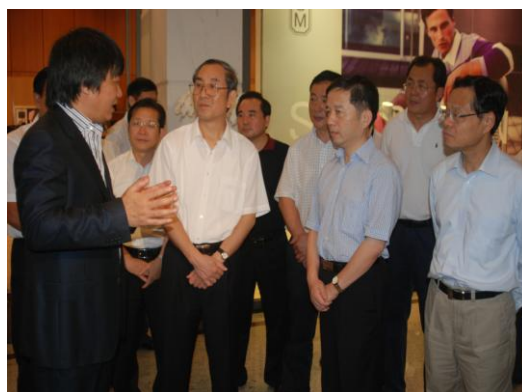
时任浙江省委书记赵洪祝考察夏梦一行