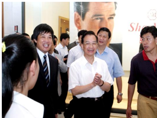
时任国家总理温家宝同志考察夏梦一行