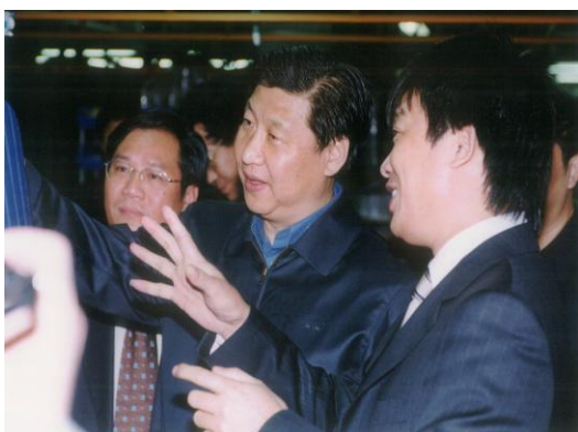
国家主席习近平考察夏梦一行