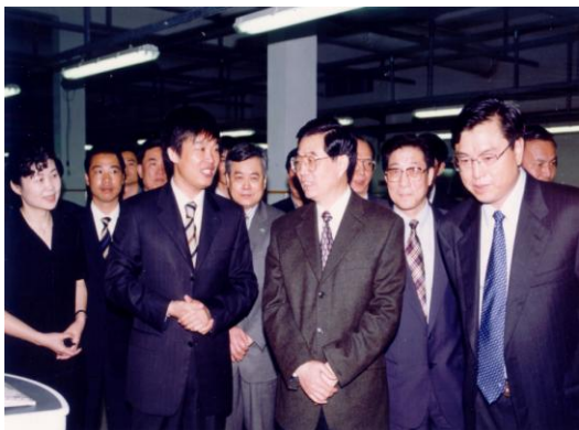
时任国家主席胡锦涛同志考察夏梦一行