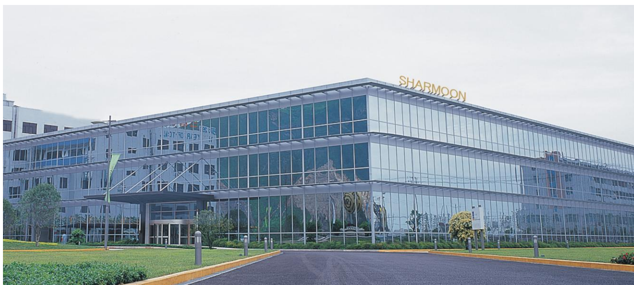
（公司图片 1：厂区外景）

夏梦·意杰服饰有限公司创立于民营企业的发源地、中国服装名城——温州；是一家专业生产“夏蒙 SHARMOON”牌高档男式西服套装及系列男装的中意合资企业。2003 年 7 月，中国夏梦服饰有限公司和意大利杰尼亚公司（Ermenegildo Zegna）共同出资 1 亿元人民币成立。